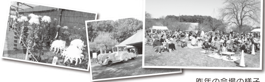
昨年の会場の様子